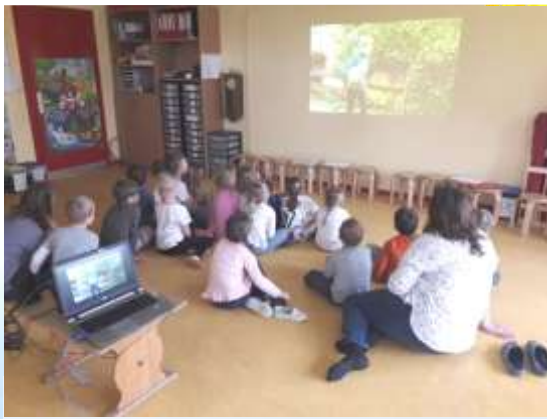
Kinder schauen einen gut gemachten Lehrfilm an: Mobbing in Kitas verhindern!

Mobbing und Gewalt in Duisburger Kitas verhindern! Das Thema Mobbing ist längst in den Kitas und Grundschulen in Duisburg angekommen – gehört dort nicht selten zum Alltag. Was Mobbing so gefährlich macht, ist, dass es – anders als bei körperlicher Gewalt – keine offensichtlichen äußeren Anzeichen dafür gibt. Mobbing, Missbrauch und Gewalt können nicht ignoriert werden, denn es kann bei einem einzelnen Kind ein Leben lang andauern. Es isoliert einzelne und treibt sie aus der Gemeinschaft