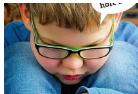
Kinder psychisch stark beeinträchtigt

psychische Gesundheit von Kindern und Jugendlichen in der Pandemie beeinflusst wird, nicht gerecht. Auch wenn wir uns empirische Daten dazu anschauen.“